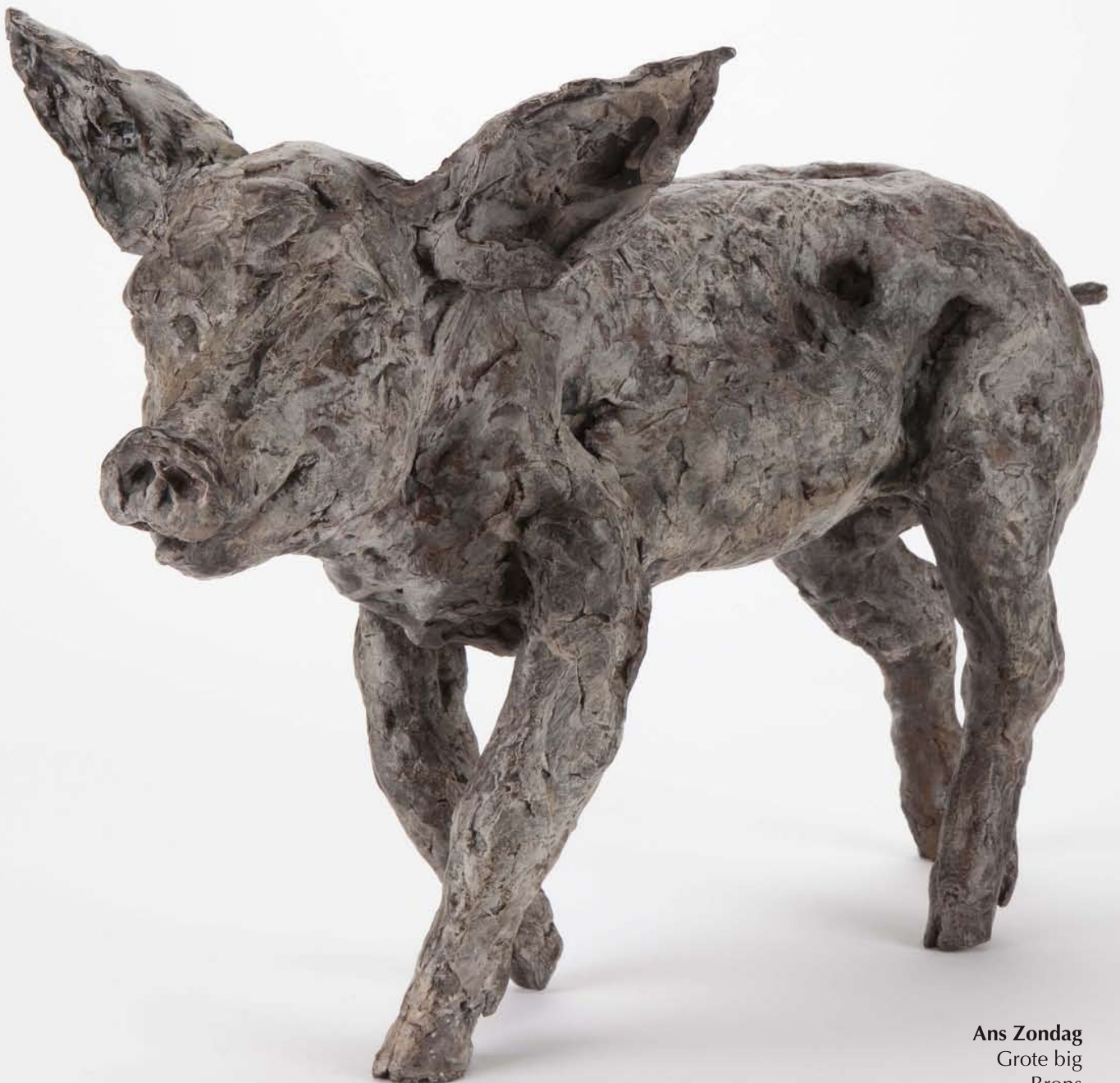
Ans Zondag Grote big Brons