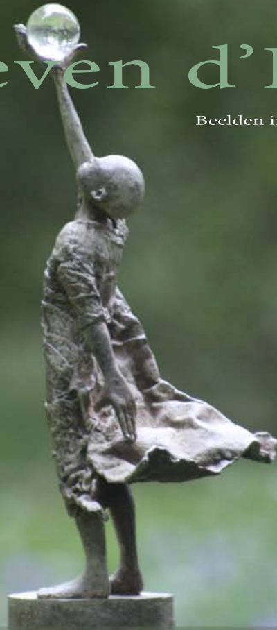
Lieven d'Haese Vision - small Brons op console van arduin