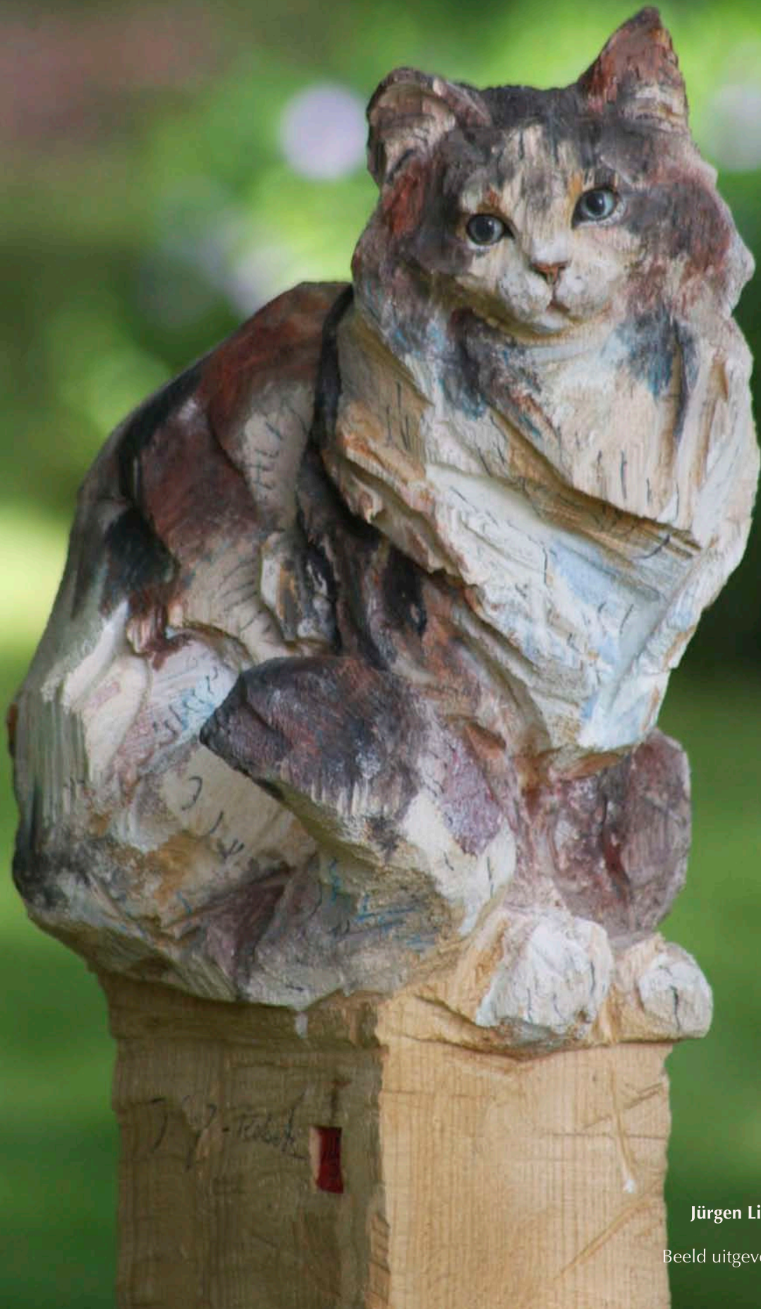
Jürgen Lingl-Rebetez The cat Beeld uitgevoerd in hout