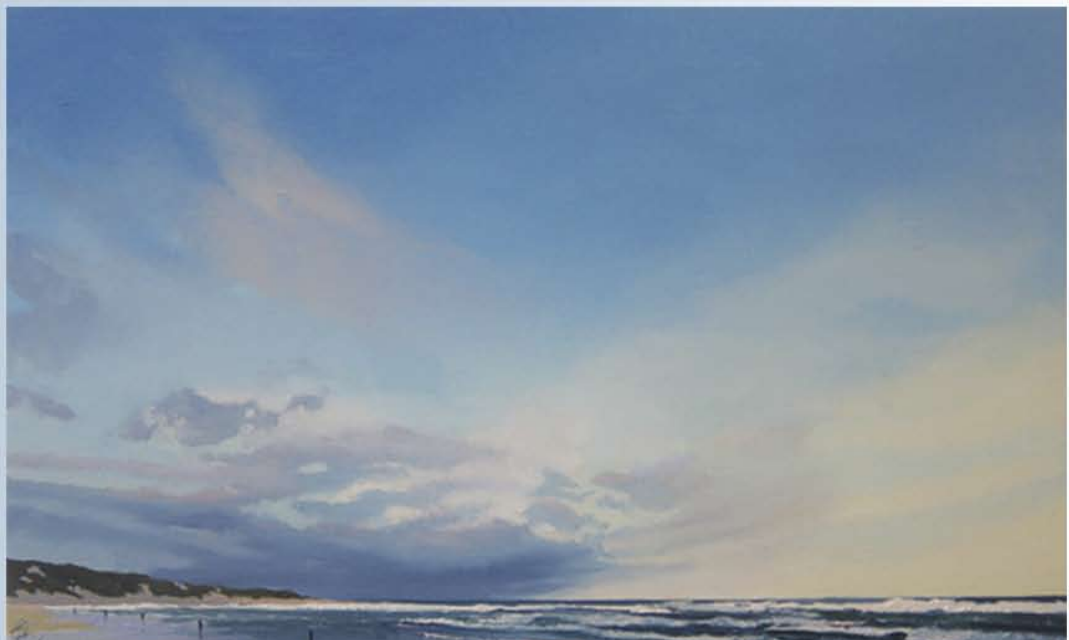
Olie op paneel Hoogwater 18 x 30 cm