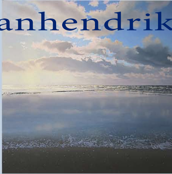
Olie op paneel Jetty 90 x 90 cm