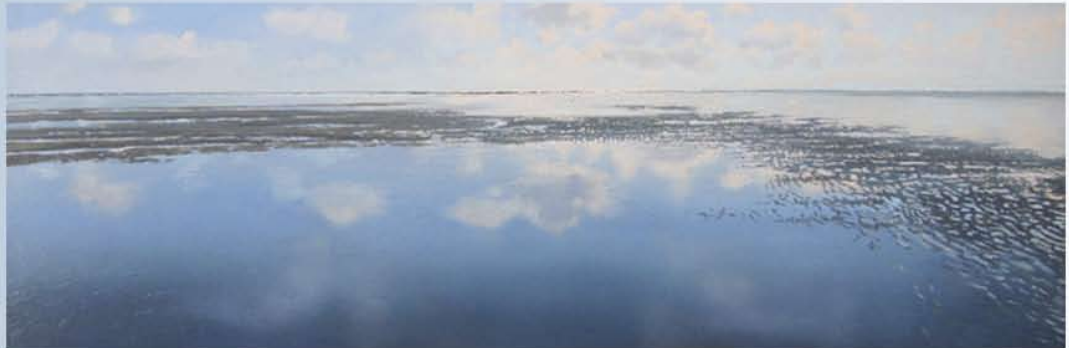
Olie op paneel Droogvallend Wad 30 x 90 cm