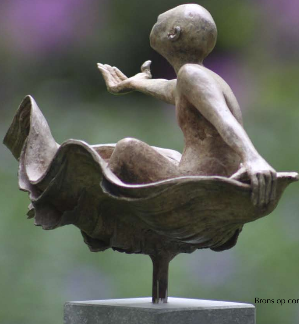
Lieven d'Haese Soap Brons op console van arduin