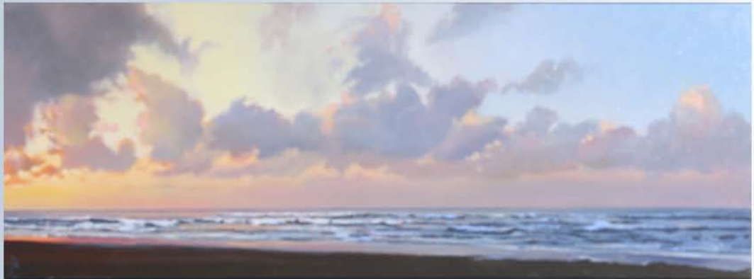
Olie op paneel Zonsondergang 15 x 45 cm