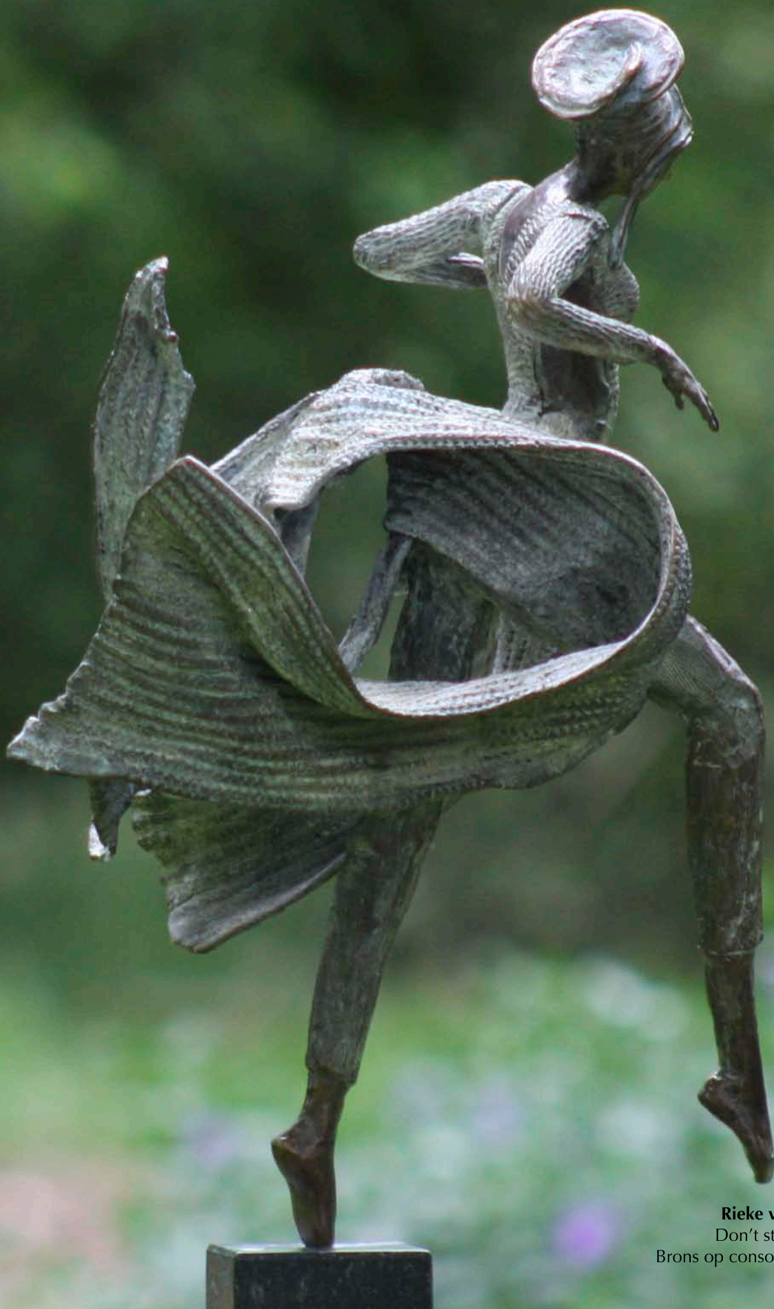
Rieke van der Stoep Don't stop the dance Brons op console van arduin