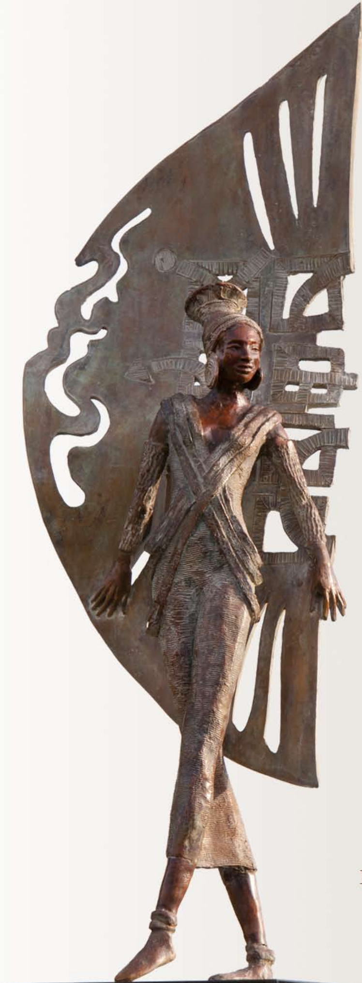
Rieke vd Stoep Sculptures